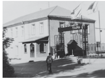
ЗАО «ТАРА» на ул. Комитетская, 2000-е гг.