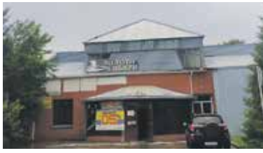
Современный вид здания Торгового Дома «ТАРА», перестроенного в 1990-х гг. из закрытого клуба им. Октябрьской революции (КОР).

В дальнейшем АОЗТ «ТАРА» было преобразовано в ЗАО «ТАРА» (Постановление Главы территориальной администрации Болотнинского района №216 от 27 мая 1993 года, свидетельство №24).