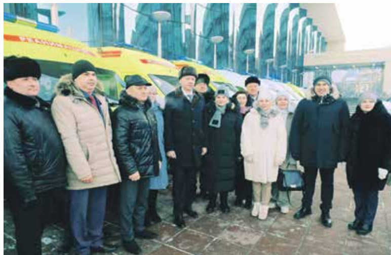
(использованы материалы министерства здравоохранения Новосибирской области. https://zdrav.nso.ru/news/ ).

44 новые машины, в том числе 5 реанимобилей, будут обслуживать вызовы скорой помощи в Новосибирске. За пять лет — с 2018-го по 2022-й — парк машин скорой медицинской помощи Новосибирской области обновили на 207 единиц и пополнили 19 автомобилями, предназначенными для борьбы с коронавирусом.